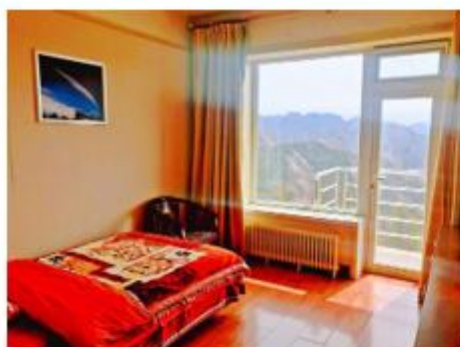
<单人房间情况>迎宾楼/综合楼