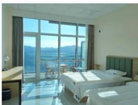
参星楼家庭套房 (1.8 米*1+1.5 米*1)