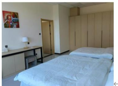
参星楼亲子套房 (1.8 米*1+1.35 米*1)